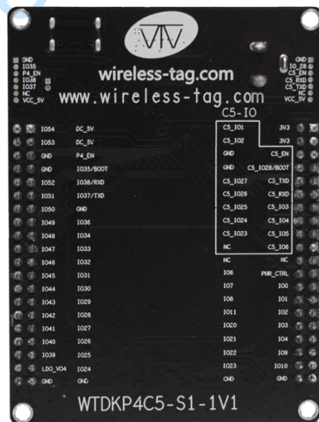
图2: WTDKP4C5-S1 开发板 (背面)