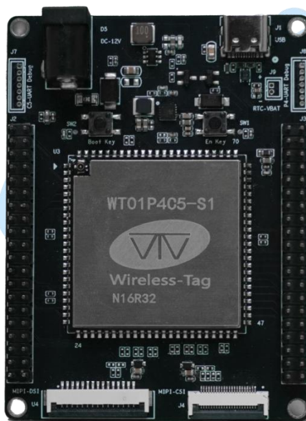
图1: WTDKP4C5-S1 开发板 (正面)